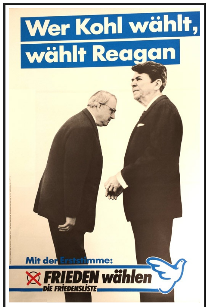
Wer Kohl wählt, wählt Reagan

In the inventory, the square brackets around dates indicate that the dates were supplied by reference to the Europeanadigital archive.